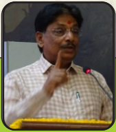
Shri Rushikesh Patel Hon'ble Minister Of Health GUJARAT

Addressed talks about "Vasudev Kutumbakam" and explained importance of live and let live.